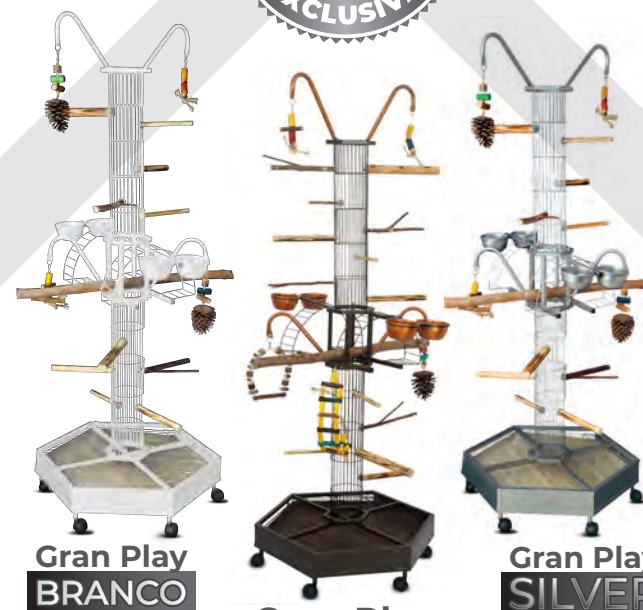
Gran Play BRANCO